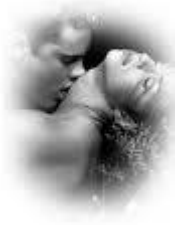
Segunda boda –Lynne Graham

No mostró ningún interés mientras Caroline le enseñaba las habitaciones del piso de abajo, en las que su madre no había escatimado dinero para amueblar.