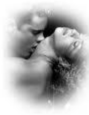
Segunda boda –Lynne Graham

En ese momento, consciente de que Valente se daba cuenta cuando no comía, hizo un esfuerzo real por tener apetito y consumir una cantidad razonable de la comida que le servían. Lo que le molestaba era estar intentando complacer a Valente, del mismo modo que había intentado complacer a Matthew, y había fracasado. ¿Cuándo podría hacer lo que a ella le apeteciese? Cuando terminaron de cenar, Valente se dirigió a Umberto en italiano y la hizo subir la magnífica escalera de mármol.