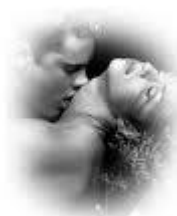
Segunda boda –Lynne Graham

—Cierra los ojos, relájate y disfruta —le dijo Valente, separándole los delgados muslos.