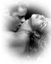
Segunda boda –Lynne Graham

Caroline se sintió abochornada cuando vio que su madre se mostraba encantada con la noticia. Como Valente era rico, Isabel ya no tenía nada en contra de él. Caroline no fue capaz de mirarlo, pero sí vio que su padre parecía aliviado al ver que hacía lo correcto tanto para su familia como para el negocio.