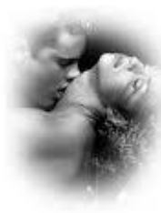
Segunda boda —Lynne Graham

Caroline sintió angustia, porque sabía que Valente pronto se sentiría desilusionado y la odiaría. Recordó cómo, cinco años antes, había deseado inocentemente que le hiciese el amor. Por aquel entonces no le había